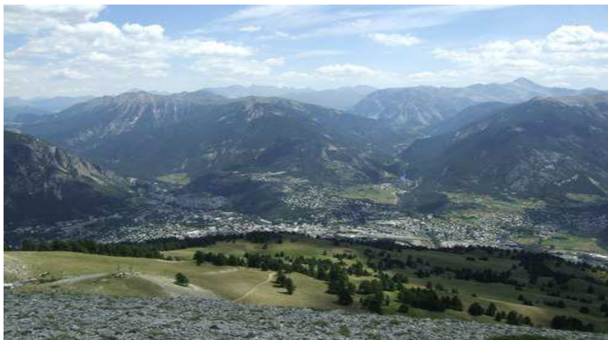
La ville de Briançon et la Vallée de Serre Chevalier

Distance de : #Grenoble : 100 km #Gap : 90 km #Turin : 110 km